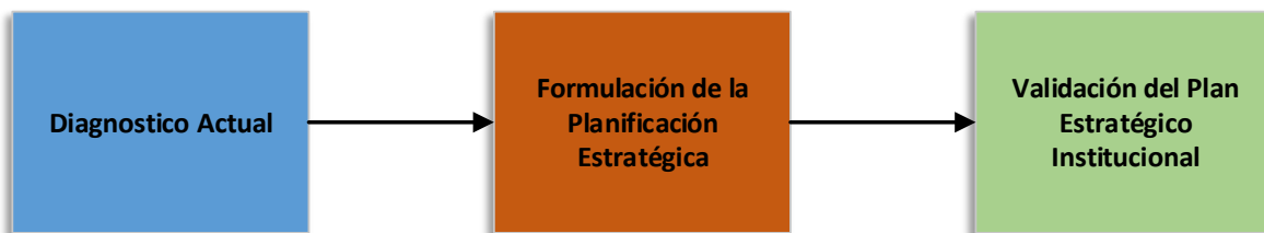
Figura No1. Metodología Elaboración del PEI

Como última etapa se realizó la validación del Plan Estratégico Institucional mediante la revisión en conjunto de los actores involucrados en el proceso de la realización del diagnóstico actual en materia de ciencia, tecnología e innovación.