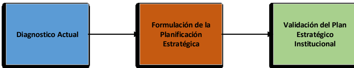
Figura No1. Metodología Elaboración del PEI

Como última etapa se realizó la validación del Plan Estratégico Institucional mediante la revisión en conjunto de los actores involucrados en el proceso de la realización del diagnóstico actual en materia de ciencia, tecnología e innovación.